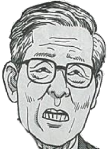
新型コロナウイルス感染症対策分科会 会長 尾身 茂

こういうパンデミックで オリンピックをやるということは、普通はない 。オリンピックをやるんならですね、強い覚悟でやってもらう必要があると思います。なるべく早い時期に我々の考えを正式にしかるべき場所に表明するのが我々の責任だ。 (2021.6)